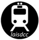
TABELA DE INSTRUÇÕES